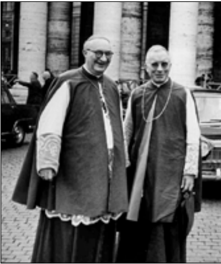
Mgr. Lefebvre en de Kroatische Mgr. Šeper, Rome 1963

is geen bevoegd gezag om een oordeel te geven over de waarheid of onwaarheid op godsdienstig gebied.” 9