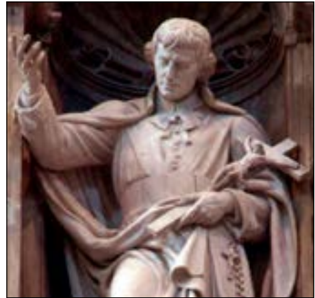
H. Grignon de Montfort

Pater Kolbe heeft het “Geheim van Maria”, een geschrift van de hand van de H. Grignon, vertaald en in Polen verspreid. In het voorwoord stelde Pater Kolbe een korte biografie op van de H. Grignon en een samenvatting van diens spiritualiteit. Hij legde daarbij de nadruk op de gelijkenis in situatie in de toch verschillende periodes waarin zij beiden leefden: ten tijde van de H. Grignon waren immers de jansenisten de vijanden, heden ten dage zijn het de