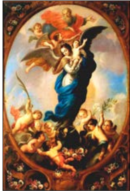
O.L. Vrouw van de Apocalyps

Pater Kolbe wil dat de Ridders van de Onbevleete zich identificeren met de apostelen van Jezus en Maria op het einde der tijden: "Ons doel en de middelen om dit ideaal (apostel zijn van Jezus en Maria) te bereiken zijn geheel in overeenstemming met de zienswijze van Louis-Marie. Het grootste verlangen van heel zijn leven was de Onbevleete