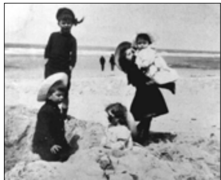
Met de kinderen op het strand