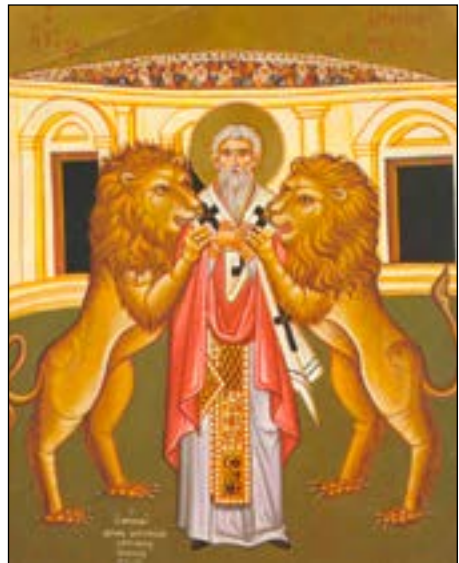
H. Ignatius, martelaar

Omstreeks het jaar 100 wordt bisschop Ignatius van Antiochië in gevangenschap naar Rome gevoerd en dan zien we, dat in alle kustplaatsen, waar het schip aanlegt, vertegenwoordigers van de gemeenten van