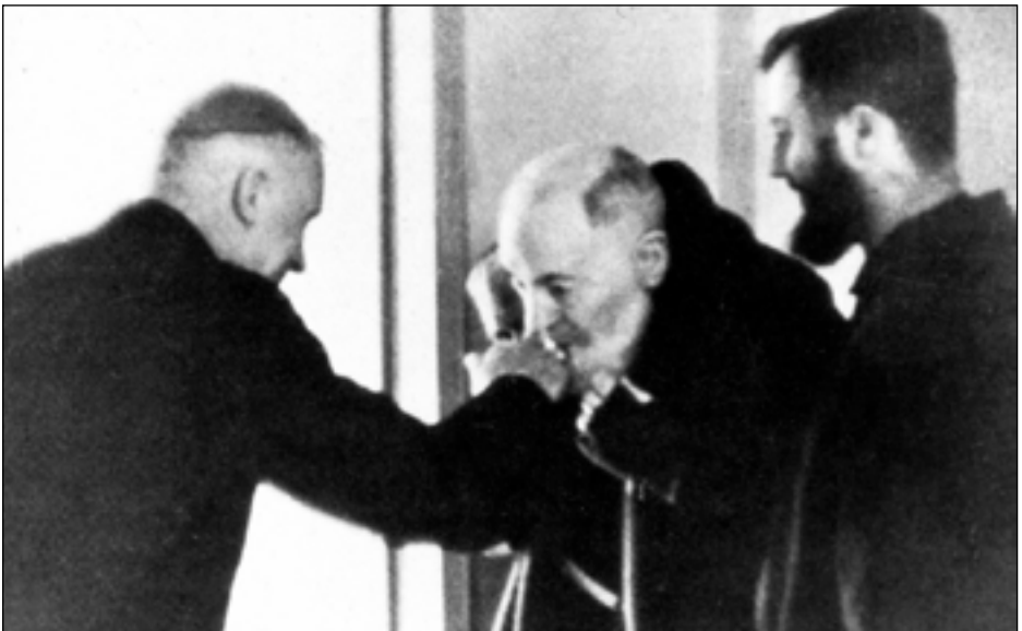
27 maart 1967, Mgr. Lefebvre bezoekt Pater Pio