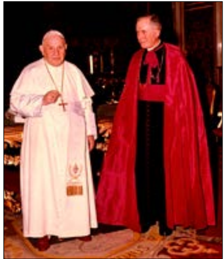
Mgr. Lefebvre en Paus Johannes XXIII

Het ergste van de godsdienstvrijheid van Vaticanum II zijn de gevolgen: de verwoesting van het publiekrecht van de Kerk, de dood van de maatschappelijke heerschappij van Onze Heer Jezus Christus, en tenslotte de godsdienstige onverschilligheid van de mensen. De Kerk kan volgens het concilie in feite nog wel een speciale erkenning van de kant van de Staat genieten, maar zij heeft niet het natuurlijke en voornaamste recht op deze erkenning, zelfs niet in een natie met