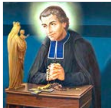
H. Grignon de Montfort

Het is daarom zeer wenselijk en ook beter om beide toewijdingen te doen om aldus een volmaakter Ridder van de Onbevleete te zijn, ook al is het niet verplicht. Het zich binden, het zich geven, is echter altijd een teken van liefde. Hoe meer we onszelf aan Maria geven, hoe groter onze liefde voor haar is en hoe beter zij ook van ons als instrument gebruik kan maken. De verplichtingen die men op zich neemt, de inspanningen die