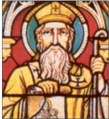
H. Irenaeus van Lyon

Met ontzaglijke menselijke arbeid en verschrikkelijk lijden was dit resultaat bereikt. Want Gods genade werkt in mensen en door mensen, en wie wil opgenomen worden in het Mystieke Li-