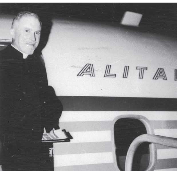
Monseigneur stapt in het vliegtuig dat hem naar ... Rome brengt.