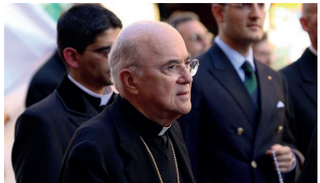
Mgr. Carlo Maria Viganò

“Er is nog een aspect dat ik wil benadrukken. De ontkenning van dogma's en theologische waarheden, zelfs deze die niet plechtig zijn gedefinieerd, heeft een zeer destructief gevolg. Want van de Waarheid — die God zelf is — kunnen niet bepaalde delen opgeofferd worden. Als men raakt aan een ogenschijnlijk marginaal dogma in verhouding tot Drievuldigheids- of christologische dogma's, tast men de volledige leerstellige constructie aan. En tevens herinner ik eraan dat we, naast de verschrikkingen van het vermengen van Mariale tradities — op 12 december noemde de Paus de Maagd Maria ook een ‘samenraapsel’ —, ook misvattingen hoorden over de Godheid van Christus zelf. Dit werd stiekem geïnsinueerd