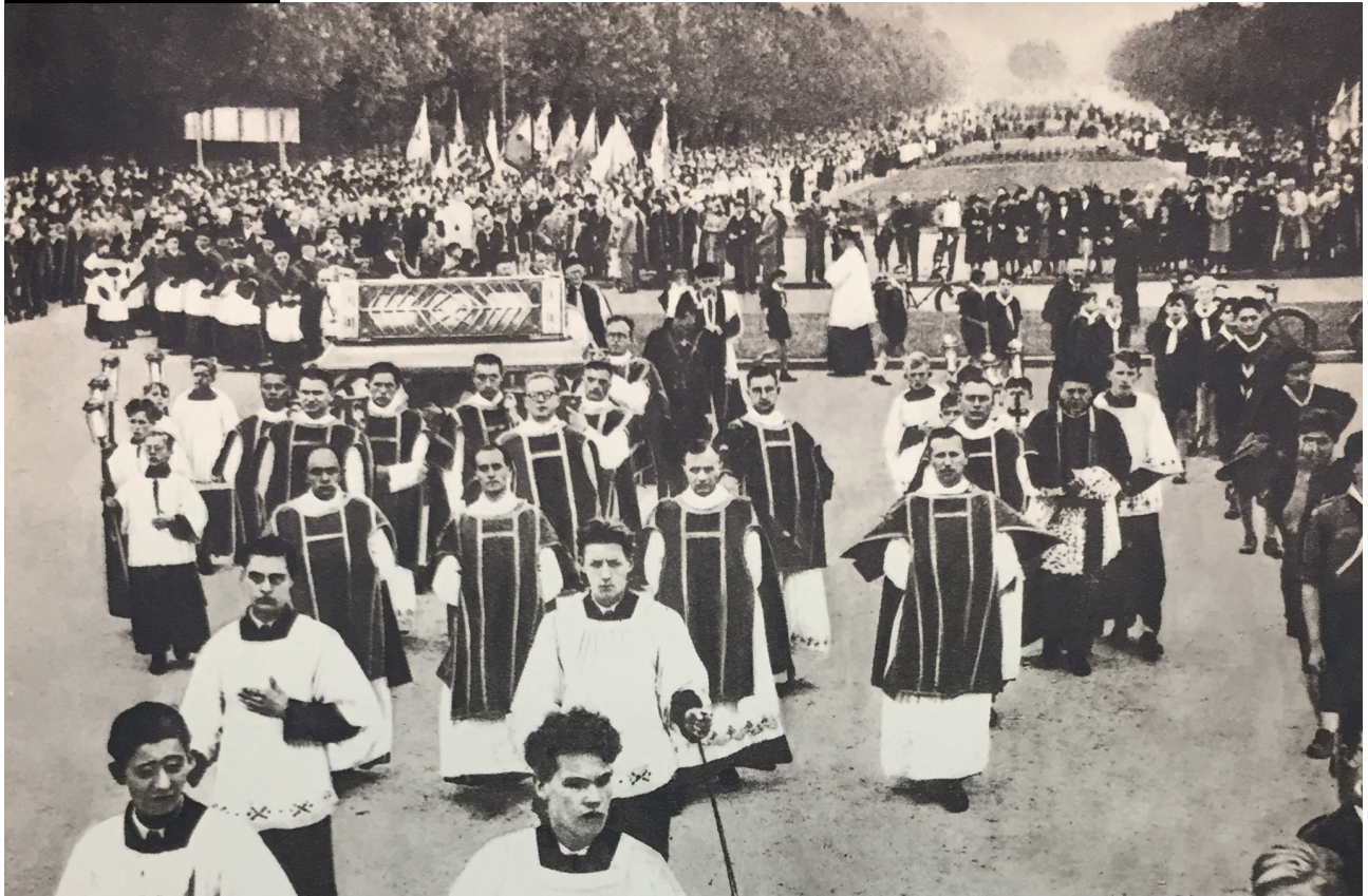
De plechtigheid der overbrenging van de relikven van St.-Albertus van Leuven (1951).