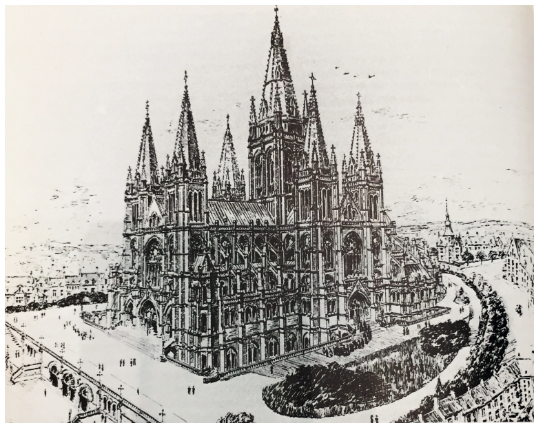
Geheel ontwerp van de neogotische basiliek van Langrock (1905).

Alhoewel de Eerste Wereldoorlog uiteraard de