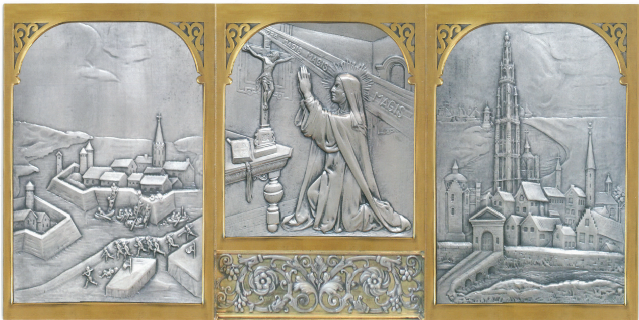
Zijkant van de reliekschijn van de Z. Anna van St.-Bartholomeus in de Karmel te Antwerpen.

de stad om de volgende ochtend al de H. Mis bij te wonen.