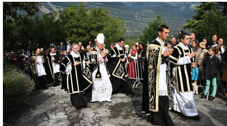
Ceremonie van de verplaatsing van het stoffelijk overschot van Mgr. Lefebvre op 24 september 2020.