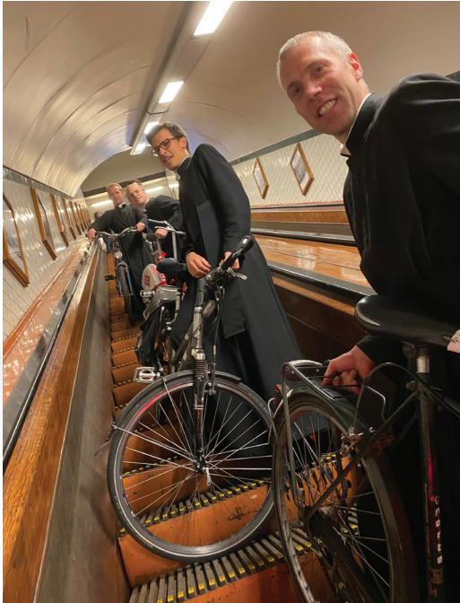
Confraters uit Bitche op bezoek