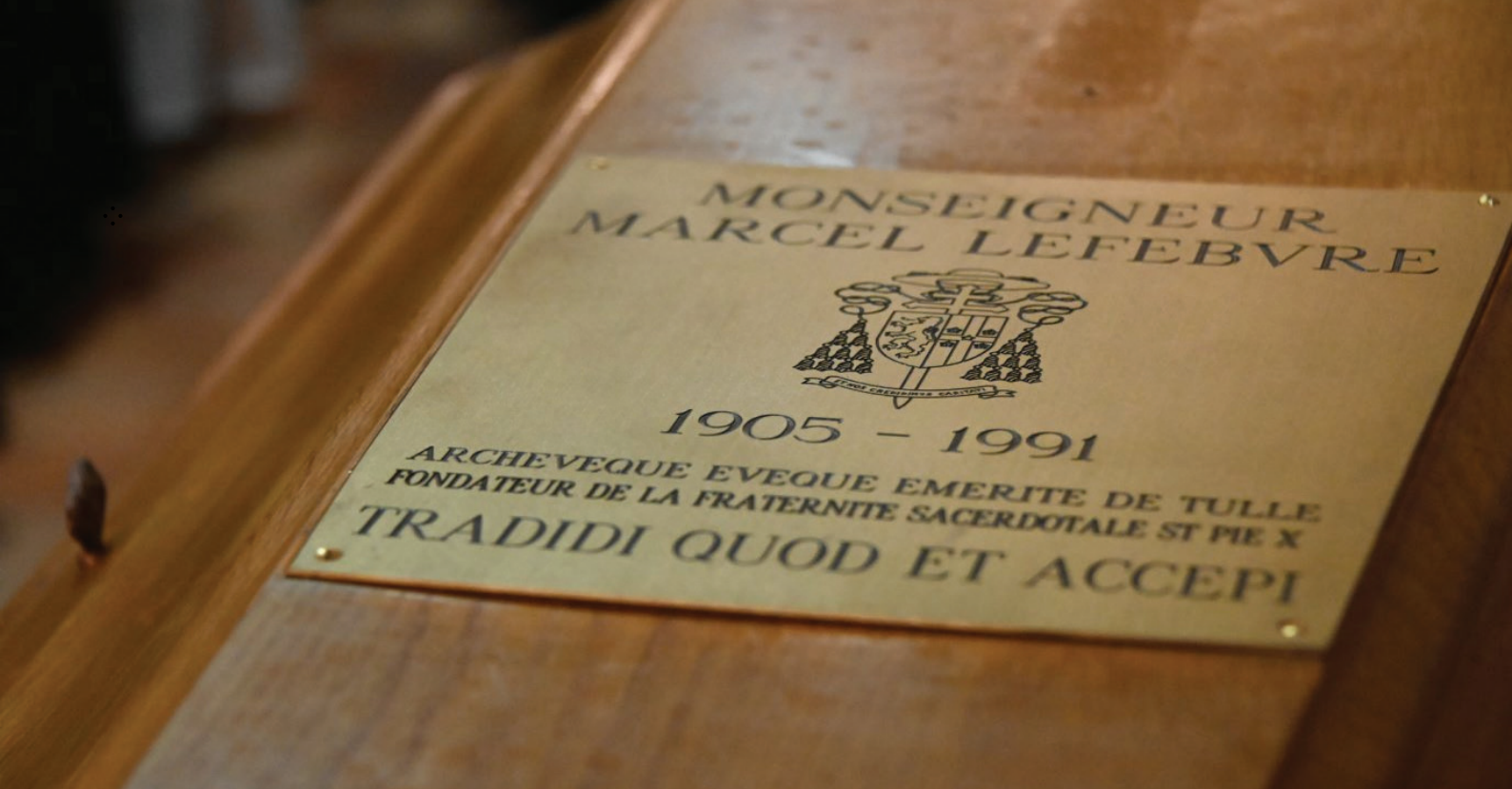
De kist van Mgr. Lefebvre in de crypte van de kerk van het Onbevleete Hart van Maria te Ecône.