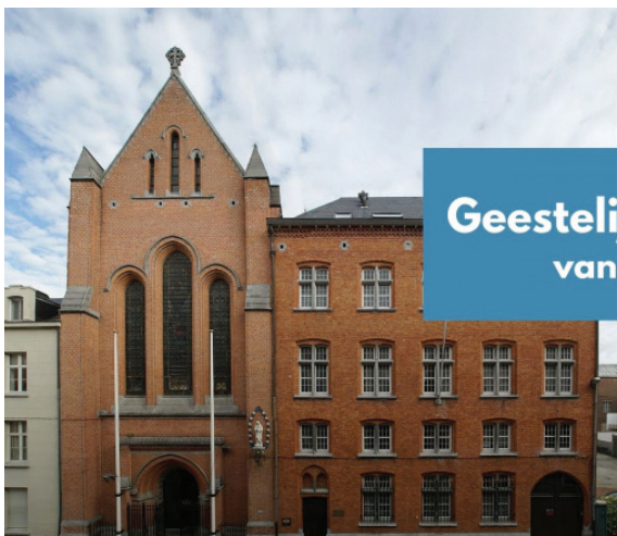
Priorij van het Allerheiligste Sacrament Hemelstraat, 23 2018 Antwerpen hemelstraat.info@fsspx.be

met als feestdag O.-L.-Vrouw van Zeven Smarten.