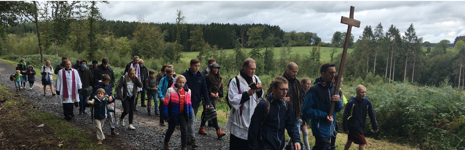
De Nederlandstalige groep op bedevaart in Banneux.

boek Esther. Aman, een hoogmoedig man, werd door de koning tot rijksvizier verheven. Hij vergat dat gezag geschonken wordt tot verwerkelijking van het algemene goed. Aman gebruikte zijn gezag om zichzelf te verrijken en geëerd te worden. De Satan, mijn dierbaren, Lucifer, was door God tot de lichtdrager, de heerlijkste onder alle engelen, gemaakt. Het lag echter niet in zijn gedachten God te eren, maar zichzelf een troon te bereiden. Net zoals Aman in het boek Esther wil Satan iedereen ombrengen die weigert voor hem op de knie te vallen en weigert hem te aanbidden. Hij wil alle zielen in het verderf storten. Zo ook wilde Aman het Joodse volk, het uitverkoren volk Gods, verderven. Hij kreeg het van de koning gedaan, dat er een onveranderlijke wet geproclameerd werd, dat iedereen die niet voor Aman, hemzelf, zou buigen omgebracht moest worden. En zo geschiedde het. Ook voor ons geldt deze wet. Als we in doodzonde sterven, wacht ons de eeuwige dood van de hel.