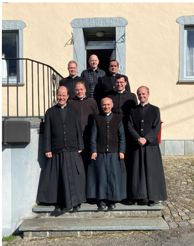
Onze priorij is een retraitsenhuis. We moedigen de gelovigen vaak aan de retraites te volgen om hun geestelijk leven te versterken. Ook priesters hebben deze hulp nodig. Daarom kwamen begin oktober de priesters van het Benelux-district in Steffeshausen samen voor hun jaarlijkse retraite, gepredikt door E.H. Laroche, die voor deze taak uit Zaitzkofen was gekomen.

handcommunie onder beperkte voorwaarden konden tolereren, met alle voorzorgsmaatregelen opdat deze tolerantie geen oneerbiedigheid jegens de eucharistie zou teweegbrengen, in de wet of in feite.