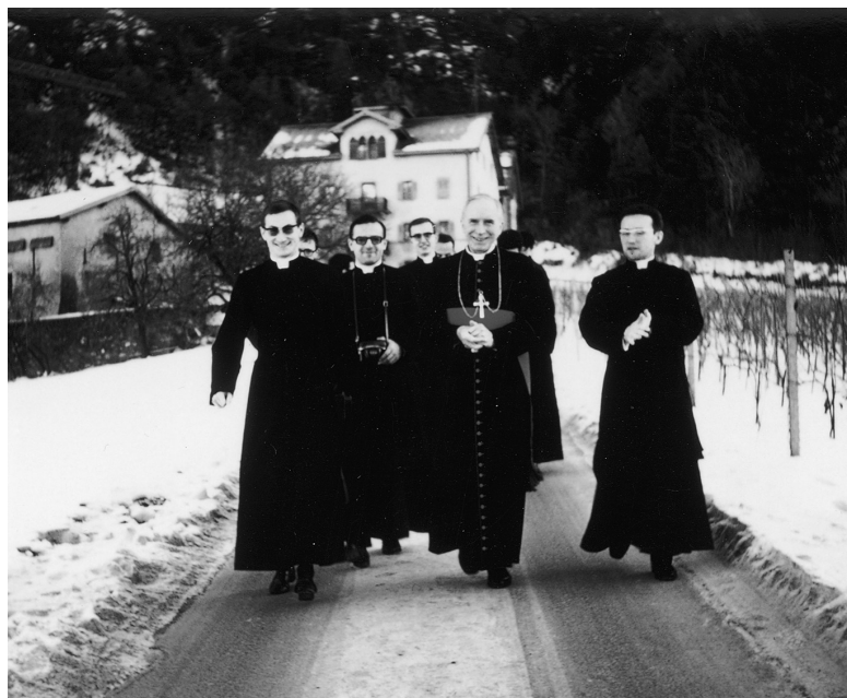
Monseigneur met zijn seminaristen in Écône (1971).