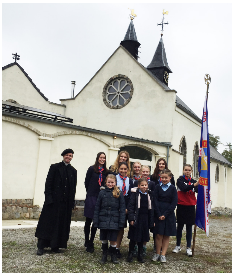
De EK-Meisjes op stap naar Leuven na de H. Mis in Bierbeek,

Als positieve redenen onderstreept de instructie dat de communieritus “een eeuwenoude traditie” heeft, “een zeer oude en eerbiedwaardige traditie”; dat het “de eerbied uitdrukt van de gelovigen jegens de eucharistie”; dat het “op geen enkele manier de persoonlijke waardigheid schaadt van degene die tot het hoogverheven Sacrament nadert”; dat het “gepast is voor de noodzakelijke voorbereiding om het Lichaam van de Heer te ontvangen op de meest vruchtbare manier”; dat door deze ritus, “de