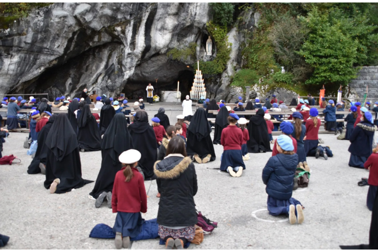
1,5 meter afstand bij de grot van O.L.V. van Lourdes tijdens de FSSPX-bedevoert van oktober 2020.

toegevoegd, zijn bijvoorbeeld “uitgesproken vrees”, “zonder de vereiste toestemming”, “mensen die nooit tevreden zijn met de wetten van de Kerk”, enz. Zoals bisschop Bugnini schreef: “De veranderingen die door de Paus zijn aangebracht, tonen met welke aandacht en pijn in het hart hij deze zaak opvolgde.” (op. cit., p. 625)