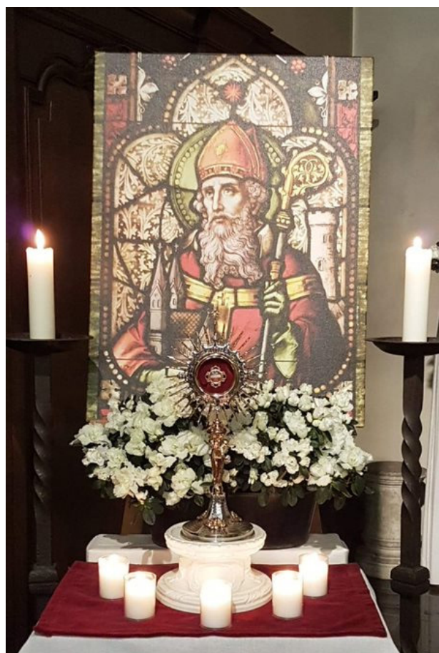
Kleine relikwie van de H. Amandus in onze St.-Amanduskapel te Gent.

Hij sterft rond 679 in zijn klooster Elnone, nu St.-Amand-les-Eaux, waar hij ook begraven wordt. Bij zijn graf gebeuren talrijke wonderen. Bij de translatio naar de kerk blijkt zijn lichaam ongedeerd. Helaas hebben de Franse revolutionairen zijn relikwieën aldaar en de abdij vernield. Er zijn er nog wel veel kleinere relieken overal verspreid. Hij is ook de patroon van Vlaanderen, bierbrouwers, apothekers en herbergiers.