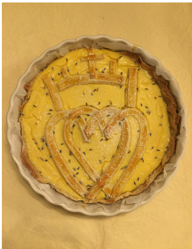
Taart gebakken door onze muzikale burens t.a.v. de geestelijken van de Hemelstraat.

God laat de mens van vandaag, vergiftigd als hij is door het positivisme (die ontkenning van de goddelijke orde), in de eerste plaats zien dat de natuur die hem omringt Gods werk is,