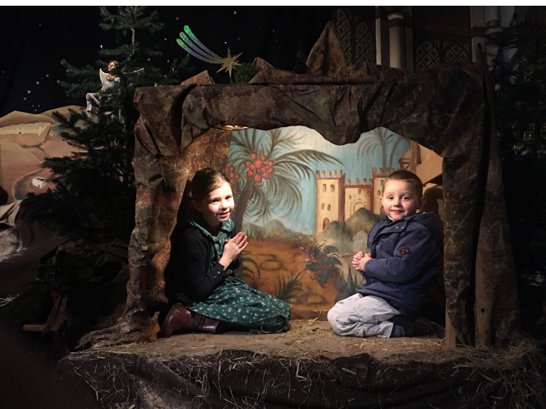
De kinderen kwamen de Broeder helpen bij de afbraak van de Kerststal.

Hij heeft eraan toegevoegd, toen Hij tot zijn Apostelen sprak: “Wie naar u luistert, luistert naar Mij; wie u misprijst, misprijst Mij.” Het College van de Apostelen, onder leiding van de H. Petrus, dat is de Kerk. En de Kerk blijft haar stem verheffen door middel van de bisschoppen en de priesters.