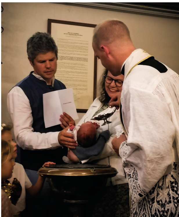
H. Doopsel van Maximiliaan.

Welk hoog aanzien de Sint-Michielsabdij genoot mag wel blijken uit het feit dat geen enkele regerende vorst Antwerpen bezocht of hij was te gast in de Sint-Michielsabdij. Om hen te herbergen werd speciaal daartoe het Prinsenhof ingericht wat niet moest onderdoen voor een koninklijk paleis. Vorsten die er onder andere verbleven waren Eduard III van Engeland (1340), Karel de Stoute (1465), Isabella van Bourbon (1462). Ze werd ziek, stierf er en werd er begraven. Verder verbleef er ook haar dochter Maria van Bourgondië en aartshertog