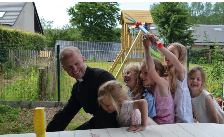
Herinnering van een leuke parochiepicknick van de Sint-Amanduskapel.