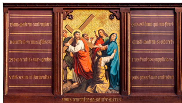
Kruisweg, statie: Jezus ontmoet zijn heilige moeder met langs weerszijden panelen met strofen uit het Stabat Mater Dolorosa.

De Kruisweg in onze kapel is uitgevoerd in een gemengde techniek. Elke voorstelling werd geschilderd op een metalen plaat. De achtergrond werd telkens bewerkt in persbrokaat. Dit is een zeer verfijnde vorm van reliëfdecoratie die meestal op paneelschilderingen werd aangebracht om stoffen weer te geven. Elke statie bestaat afwisselend