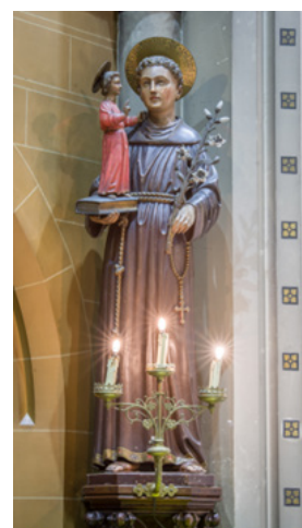
Links: Onze-Lieve-Vrouw van Pellevoisin. Rechts: Heilige Antonius van Padua.