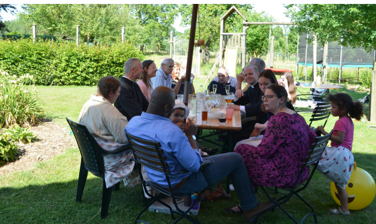
Op 24 juni, feest van Sint-Johannes de Dooper, verzamelden onze gelovigen van de Sint-Amanduskapel te Gent zich in Ellezelles voor de H. Mis, een gezellige parochiepicknick en een plezierige catechismusquiz, die door de kinderen gewonnen werd.

blijven. Als de Staat al enig recht heeft op deze rijkdommen in het algemeen belang, dan doet ze hen opdrogen, door ze haar te willen toe-eigenen en te willen verstaatsen, zoals men de bronnen zou willen verplaatsen van hun plaats van oorsprong of een fruitboom uit zijn goede grond zou halen om hem bij zich thuis te plaatsen, teneinde hem zich toe te eigenen en er de vruchten van te plukken! God heeft in zijn wijsheid aan ieder zijn rol, zijn vaardigheden en zijn verantwoordelijkheden gegeven. Door God te willen vervangen, vernietigt de mens alles.