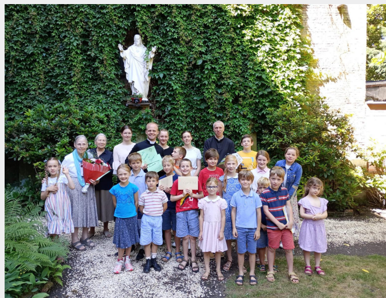
Bovenaan: Laatste Mi-vergadering van het schooljaar in Bierbeek met een gezellig kampvuur in de tuin van de Kapel van het Heilig Aanschijn. Onderaan: Groepsfoto tijdens het catechismusfeest in de Hemelstraat