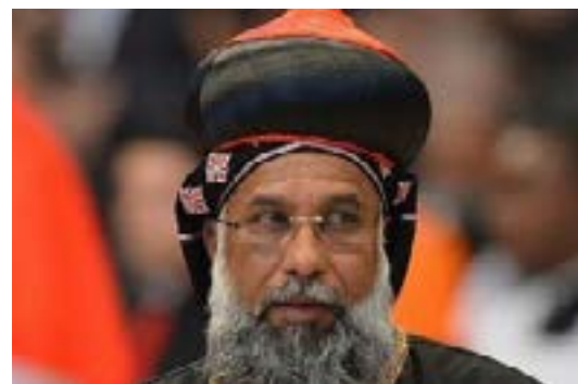
Cleemis kardinaal Thottunkal

In het noorden van India, op zo'n dertig kilometer van de stad Aligarh, hebben fundamentalistische Hindoes 72 inheemse christenen, tot de Valmiki volken behorend, die in 1995 christen geworden zijn, "bekeerd". Op 26 augustus hebben zij, in het dorp Asroi een protestantse kerk tot tempel van Shiva omgebouwd. Volgens een persbericht van katholiek AsiaNews gedateerd op 27 augustus, is het kruis dat zich op het gebouw bevond weggehaald en is er een groot beeld van de Hindoe godin Shiva op geplaatst, nadat daar een "zuiveringsrite", "shuddhi karan" geheten, uitgevoerd was.