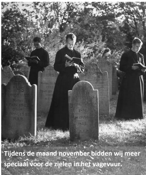
Tijdens de maand november bidden wij meer speciaal voor de zielen in het vagevuur.

en een 'Wees Gegroet' gebeden worden. Daarnaast is het aan iedere gelovige toegestaan om welk ander gebed ook te bidden naargelang van ieders vroomheid of devotie jegens de Paus.