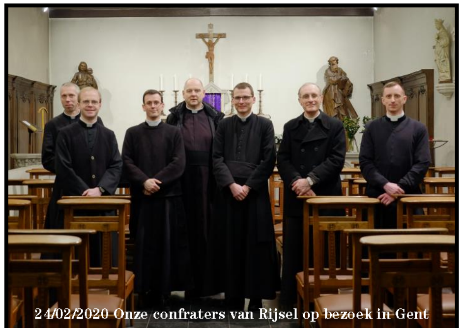
24/02/2020 Onze confraters van Rijsel op bezoek in Gent