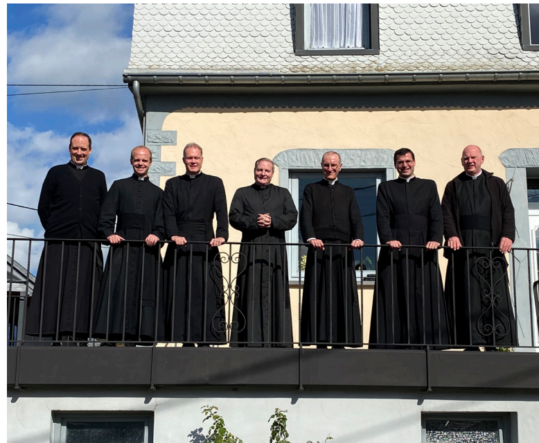
De geestelijkheid van het FSSPX-District Benelux op jaarlijkse retraite in Steffeshausen.

h) Onvermogen om de tussenkomsten van de Kerk en zijn hiërarchie in hun volledige godsdienstige betekenis te begrijpen, die gericht zijn op het sturen van de katholieken in het openbare leven, om hen op dit moment te herinneren aan de plicht tot eenheid, en om hen te waarschuwen tegen ideologieën, die, nog voordat ze politieke en sociale dwalingen zijn, echte religieuze ketterijen zijn. Het is nuttig te herinneren