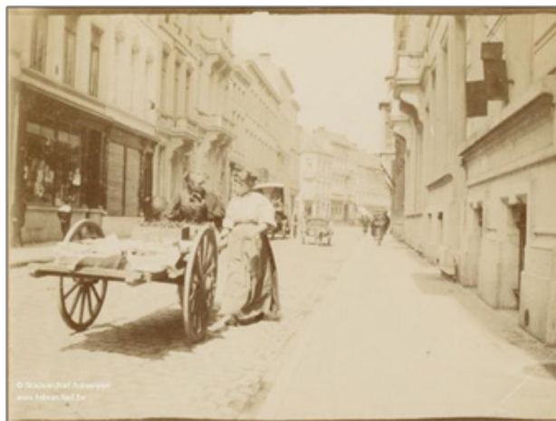
Zicht op de Lange Leemstraat, 1890