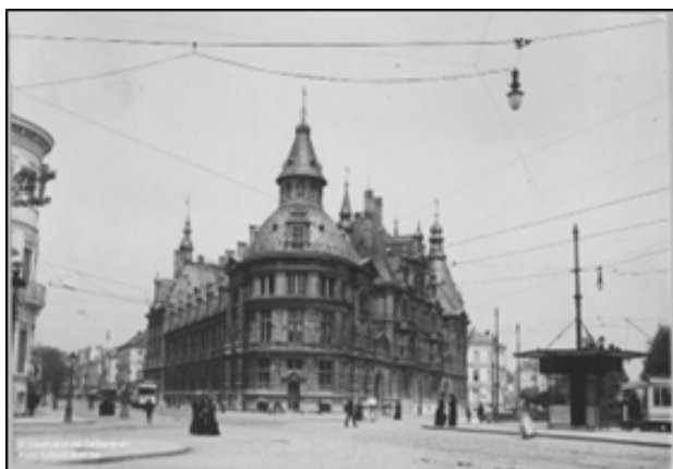
Zicht op de Mechelsesteenweg in 1890 (boven); Nationale Bank op de Belgiëlei in 1896 (onder)