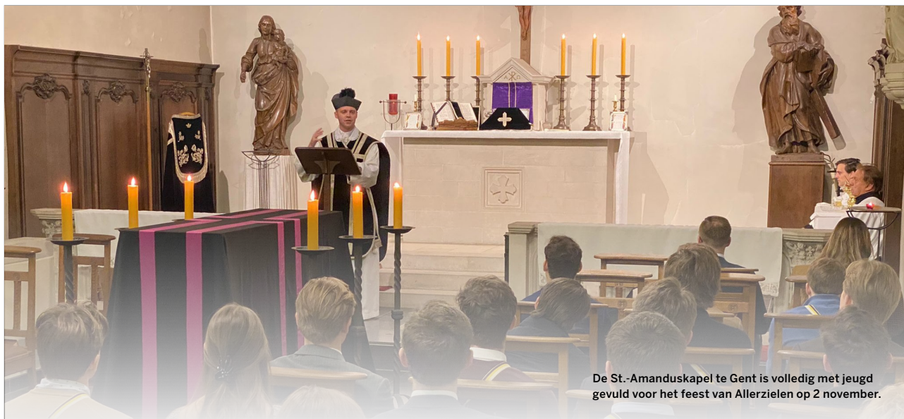
De St.-Amanduskapel te Gent is volledig met jeugd gevuld voor het feest van Allerzielen op 2 november.