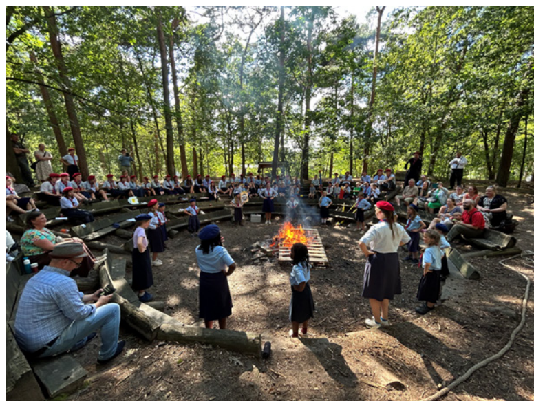
Slotkampvuur met de ouders.

Desondanks de vermoeidheid schenkt een kamp vreugde. Vreugde omwille van het unieke werk waarin wij allen ons steentje kunnen en mogen (!) bijdragen. Ik kan het niet op één hand tellen hoe dikwijls leiding mij kwam aangeven hoe mooi ze het werk van de E.K. vinden en hoe jammer het sommigen vonden nooit als kind zo iets te hebben mogen meemaken.