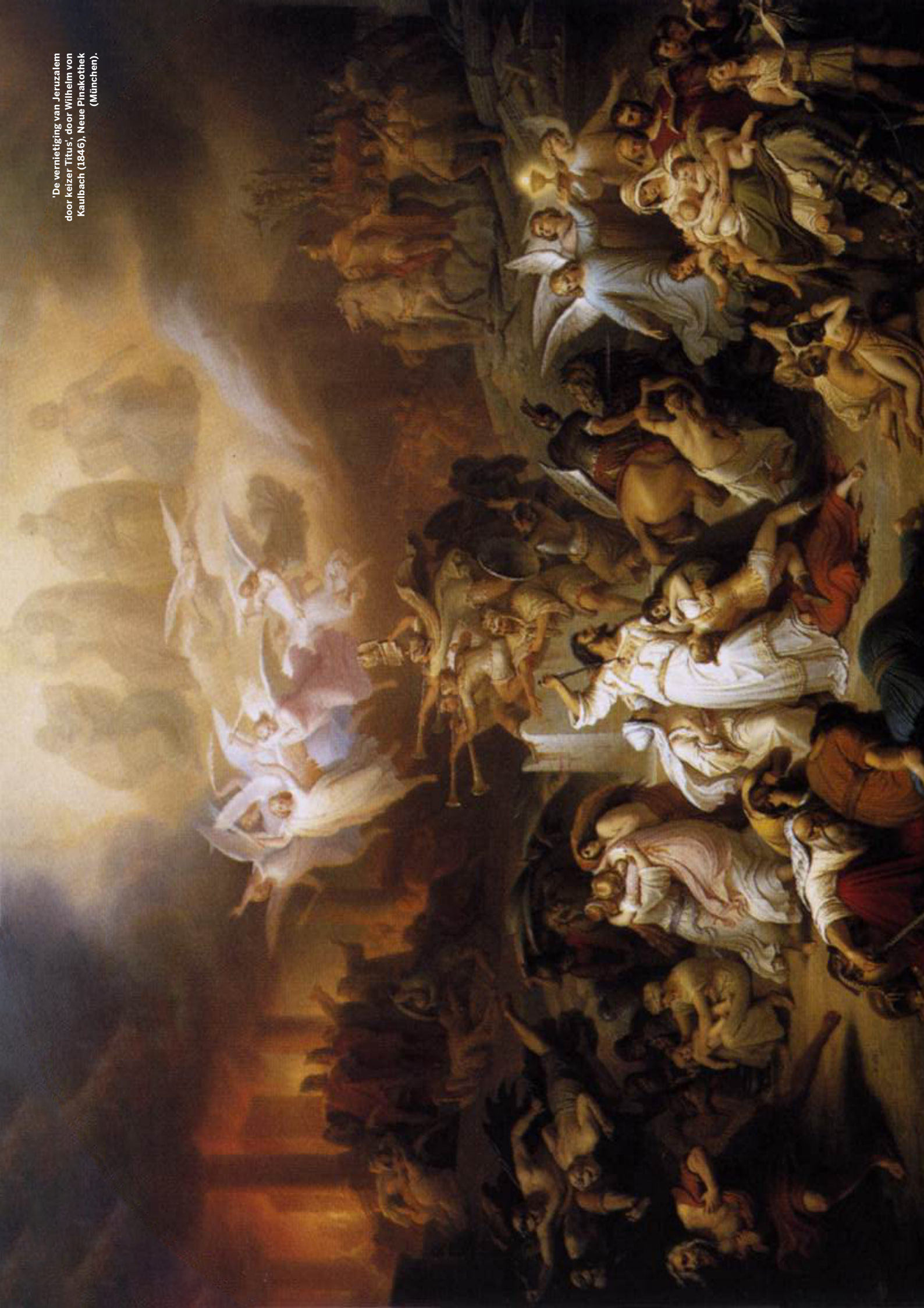
'De vernietiging van Jeruzalem door keizer Titus', door Wilhelm von Kaulbach (1846), Neue Pinakothek (München).