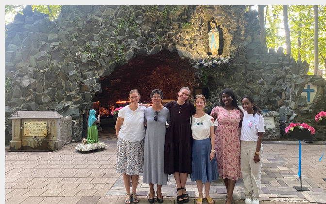
De dappere vrouwen die de 60 km tussen de Hemelstraat en het Mariapark in Meerseldreef op 19 augustus gefiets hebben. Het was een vrome en gezellige activiteit. De datum voor volgend jaar staat al vast!