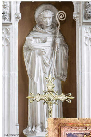
Links: de H. Bertinus Onder: de H. Omaar