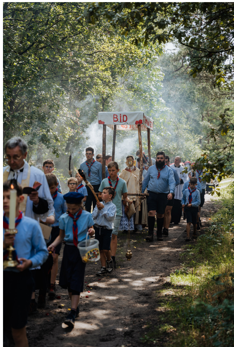
Processie van het Allerheiligste Sacrament rond het domein van het kamp met een zelfgemaakt baldakijn en toortsen, zelf geplukte bloemen ...

Ignatius en tal van andere heiligen hebben op deze manier de weg der heiligheid ingeslagen. De Heilige Christoffel wilde zijn diensten alleen aanbieden aan het allerhoogste gezag. Hij had grote plannen, hij wilde grootse dingen gaan doen in het leven. Eerst trad hij in dienst bij de koning, die echter ondergeschikt was aan de keizer. Toen hij ervoer dat er iemand boven de koning stond, trad hij in dienst bij de keizer, maar die was ondergeschikt aan de duivel. Toen bood hij aan de duivel zijn diensten aan. De duivel was echter ondergeschikt aan Christus en toen besloot Christoffel Christus te gaan dienen. De Heilige Ignatius was van kindsheid aangegrepen door het ridderideaal. Hij diende in het Spaanse leger. Hij droomde van een eerbare ridderscarrière, zijn leven voor zijn land gevend. In de strijd tegen de Fransen trof een kanonskogel zijn rechterbeen. Hij werd bedlegerig en tijdens zijn lang herstelproces begon hij boeken te lezen, natuurlijk